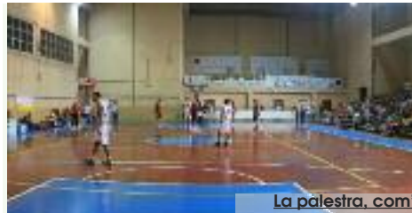
La palestra, com'era e com'è ridotta

versamente abili - afferma Angileri - e si doveva cambiare un quadro elettrico, cose fattibilissime. Il problema strutturale era stato risolto con un progetto da ventimila euro circa che aveva