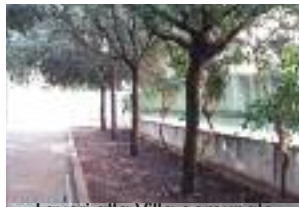
Lavori alla Villa comunale

"La palestra è stata chiusa perché la commissione pubblici e spettacoli aveva chiesto di arretrare la gradinata per adeguare l'impianto alla normativa sui di-