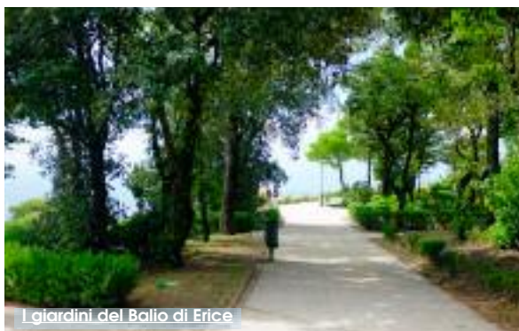
I giardini del Balio di Erice

state piantate altre specie in linea con la conformazione del giardino, è stato rifatto l'impianto idrico, migliorato sia nella sua capacità che nella sua collocazione in ogni singola aiuola. Quello vecchio era insufficiente e in alcuni punti il tracciato dei tubi era stato anche tagliato da improvvisi interventi con le motozappe». Butera aggiunge anche un aspetto non indifferente: «Prima dell'intervento ci siamo documentati con la soprintendenza: il Balio non è un giardino vincolato dal punto di vista storico. Tuttavia per scrupolo abbiamo illustrato il progetto che era di semplice manutenzione». Infine una stoccata viene rivolta allo stesso architetto Pedone: «quando il comune ci ha affi-