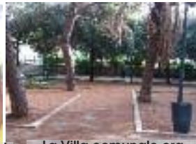
La Villa comunale ora