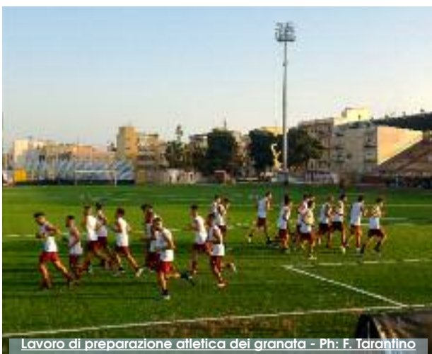
Lavoro di preparazione atletica dei granata

in merito al rinnovo del Direttore Sportivo Adriano Polenta. Si aspettano questi giorni in cui può avvenire il passaggio di proprietà del Trapani Calcio. Se ciò non avverrà, Adriano Polenta resterà per un altro anno per ricoprire la carica di Direttore Sportivo (c'è già l'accordo) con la guida tecnica che non è escluso che resti nelle mani di Stefano Firicano o venga affidata a Francesco Di Gaetano. Nell'attesa di maggiori chiarezze, domenica allo Stadio Provinciale di Erice andrà in scena la prima gara ufficiale del Trapani Calcio. Nel primo turno eliminatorio di Coppa Italia i granata affronteranno il Campodarsego. Fino a venerdì il programma degli al-