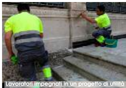
Lavoratori impegnati in un progetto di utilità

Il comune di Erice ha approvato il Piano dei Servizi ed Interventi socio-assistenziali per l'anno 2018 che destina risorse relative all'«Assegno economico per i servizi di pubblica utilità», ossia l'inserimento nei progetti per i cittadini in condizioni di disagio economico. I servizi di pubblica utilità consistono in: prestazioni di assistenza davanti le scuole; custodia, e manutenzione esterna di immobili comunali o del verde pubblico; servizi ausiliari e di manutenzione ordinaria stradale urbana. Possono presentare istanza i cittadini residenti nel Comune di Erice da almeno un anno che non abbiano patologie o condizioni di salute che ostacolino lo svolgimento delle attività. Per ogni nucleo familiare potrà essere accolta l'istanza di un solo dei componenti purché maggiorenne. I cittadini beneficiari verranno assicurati e stipuleranno con l'Amministrazione Comunale un Protocollo di Lavoro. L'impegno lavorativo richiesto è per un trimestre, per 15